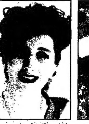
ليانا بدير (القدس العربي)